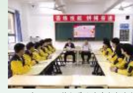
4月27日，技师学院汽车与机电技术系团总支组织学习习近平总书记在清华大学考察时的重要讲话精神。