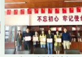
5月21日，安徽建科团委召开“五四”表彰会，表彰2020年先进集体和个人。