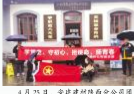
4月25日，安徽建材陕西分公司团支部组织团员青年前往八路军西安办事处纪念馆，学习抗日战争时期革命史。