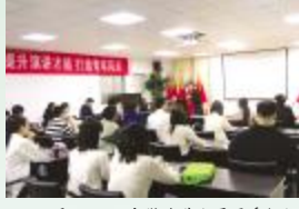
5月11日，安徽路港公司团委组织开展“提升演讲技能 打造青年风采”主题演讲培训，提升青年演讲能力水平，展示青年青春风采。