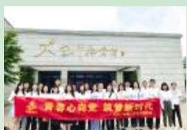
5月12日，安徽二建二分公司团支部特邀分公司党员同志共20余人前往凤阳小岗村开展以“青春心向党 筑梦新时代”为主题的五四青年节活动。