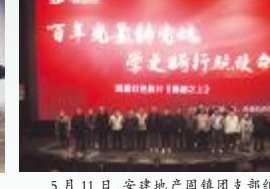
5月11日，安徽地产固镇镇团支部组织开展党史学习教育观影活动。