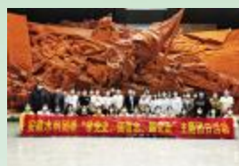
5月13日，安徽水利团委开展“学党史 强信念 跟党走”主题团日活动，赓续红色血脉，激发青春力量。