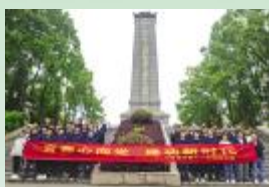
5月4日，安徽三建十一分公司团支部前往滁州市烈士陵园开展“牢记初心使命 传承革命精神”主题教育。