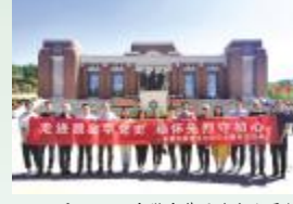
5月20日，安徽安装西北分公司组织全体职工赴照金陕甘边革命根据地纪念馆开展参观学习，从革命先辈崇高精神中感悟初心使命，汲取奋进力量。