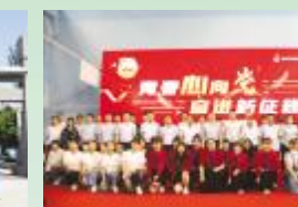
5月5日，安徽路桥路西分公司团总支联合安徽大学农民之子协会举办主题为“青春心向党 奋进新征程”文艺演出活动，充分展现路桥青年积极进取、积极向上的精神风貌。