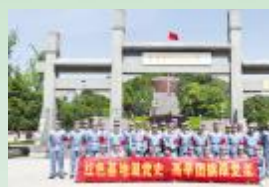
5月5日，路桥集团团委组织各级团干部及近三年优秀团员代表等40余人赴革命老区金寨开展红色教育红色基地温党史，高学团旗跟党走活动。