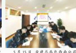
5月15日，安徽总承包西南分公司团总支召开“学党史 强信念 跟党走”专题组织生活会。