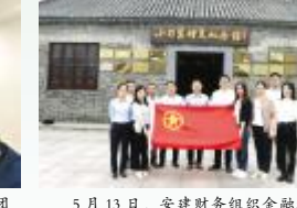
5月13日，安徽财务组织金融板块广大支部召开“学党史 强信念 跟党走”专题组织生活会。