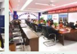
5月11日，安徽交航第三工程分公司利丰区域联合项目团支部开展“节支创效 青年先行”活动，引领团员青年创新创效，降本增效。