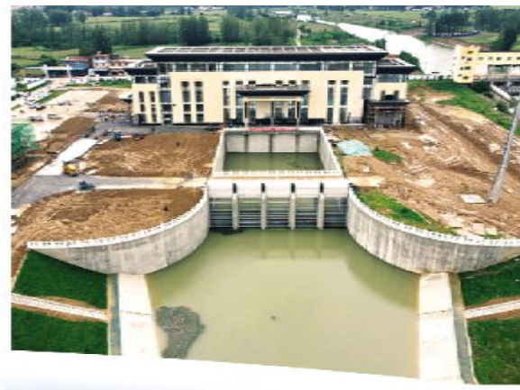
建功“十四五”，奋斗新征程