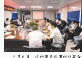
5月8日，海外事业部团组织联合党总支举办“以党史为鉴，观海外发展”主题学党史活动，青年团员员工受益匪浅，感悟颇深。