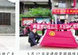
5月12日，安徽投资固镇项目与古镇民房社区团支部开展“青春激扬红五月 不忘初心跟党走”党史交流互动，双方就各自的党史学习做法、经验进行交流。