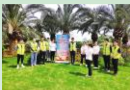
4月29日，安徽一建安庆分公司景德镇项目团支部与当地社区联合开展党史大宣讲活动，让市民群众更加了解党的光荣历程。