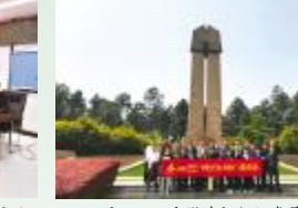
4月20日，安徽建机组织党员、团员、群众代表30余人到池州市烈士陵园、中共沿江中心县委纪念馆开展“学党史忆初心践使命”主题学习教育活动。